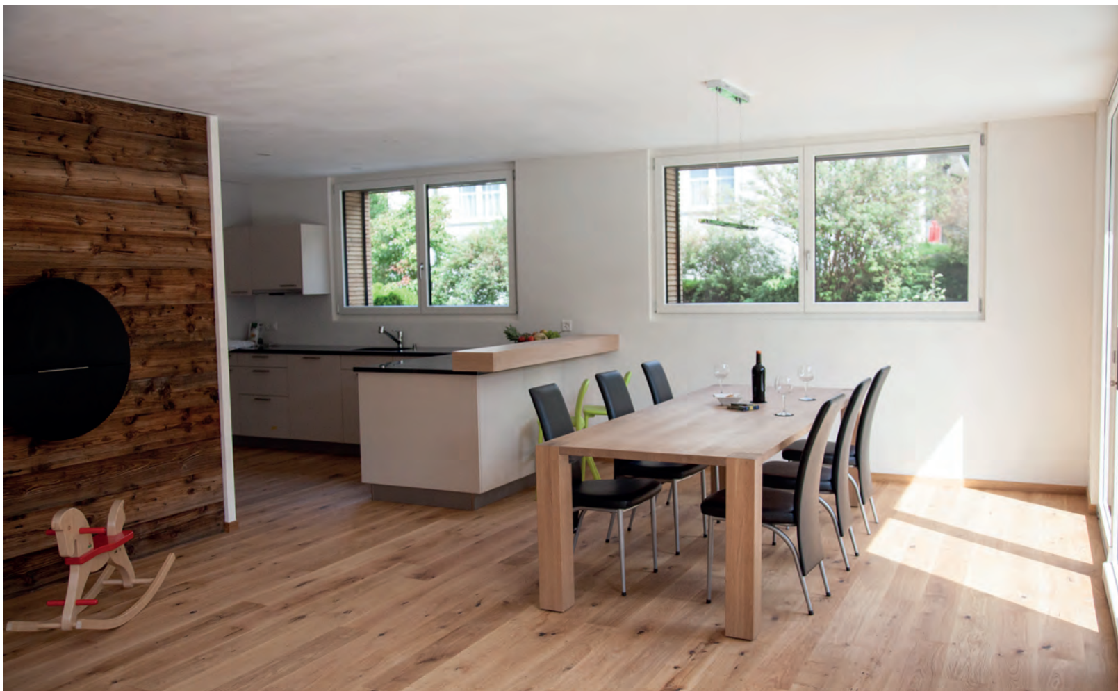
Plusenergiehaus Mollis: Gebäudehülle aus Holz, Wolle und Lehm